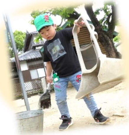
▲雨上がり。水たまりだらけの園庭を真剣に整備してくれたさつき組さん。真剣に働く姿は、パパ・ママをお手本にしているのかな？